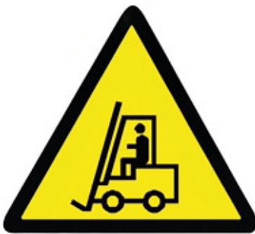
VEHICULOS DE MANUTENCION