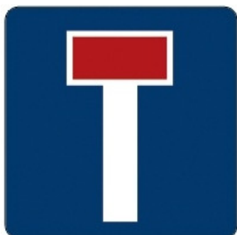
500 x 500 mm. Metálica. Ref. CV0666