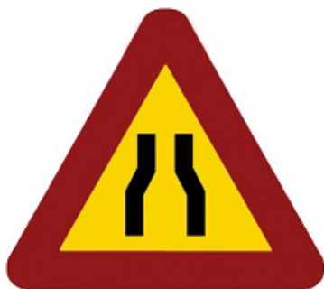
700 mm. Provisional obra. Ref. CV0608