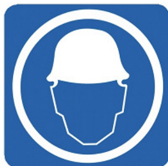
USO OBLIGATORIO DEL CASCO