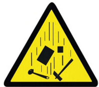
¡PELIGRO! CAIDA DE OBJETOS