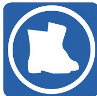
USO OBLIGATORIO DE LAS BOTAS