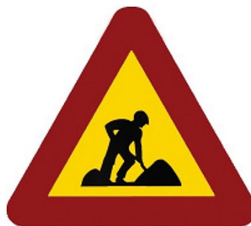
700 mm. Provisional obra. Ref. CV0611